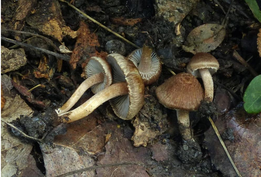
Fig. 6.1.- Inocybe pseudorubens Carteret & Reumaux .

Sinónimo: Inocybe rubidofracta E. Ferrari, Fungi non Delineati 54-55: 56 (2010)